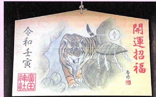
西宮廣田神社の今年の絵馬です。 毎年立派な絵馬が奉納されます。

昨年は感染も減ってきたところに、11月からオミクロン株が世界的に広がり、かなり混乱しました。日本経済もなかなか復調とならないところでした。早く新型コロナが収束して、明るく楽しい日常が返ってくることを切に願っています。